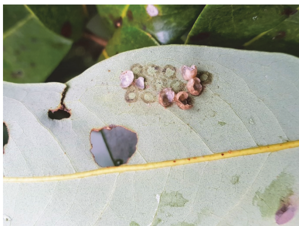
圖一 荔枝椿象卵粒遭螞蟻啃食 (呈現不規則破裂咬痕) 或移除 (僅剩葉面上環狀痕跡)。

臺灣在荔枝椿象天敵的相關研究多集中於寄生性天敵 (Chang and Chen, 2018; Wu et al. , 2018)。近年來於苗栗地區田間觀察荔枝椿象產卵過程中，常可發現卵殼呈現不規則破裂狀或卵粒全數遭到移除 (圖一)；進一步檢視卵塊受破壞痕跡，並比對已發表文獻中捕食性天敵之食痕，發現以螞蟻為最可能之原因。後續觀察也目擊螞蟻啃食卵塊，甚至常透過大量增援 (recruitment) 將大批荔枝椿象卵塊取食並移除，所造成之食痕與先前所見相符。此現象不僅符合前人描述 (Liu, 1965)，也顯示螞蟻於臺灣防治荔枝椿象之應用價值。唯螞蟻捕食卵粒之行為也可能對寄生蜂天敵防治架構產生威脅，但相關研究仍舊相當缺乏，因此，本研究將苗栗縣西湖鄉取食荔枝椿象卵粒之螞蟻進行物種鑑定，並觀察田間螞蟻移除荔枝椿象卵之生物防治效率，建立臺灣荔枝椿象捕食性天敵資料，提供未來搭配不同防治手段之參考依據，以平衡不同功能群 (functional group) 生物防治天敵間之角色，達到防治效力之最大化。