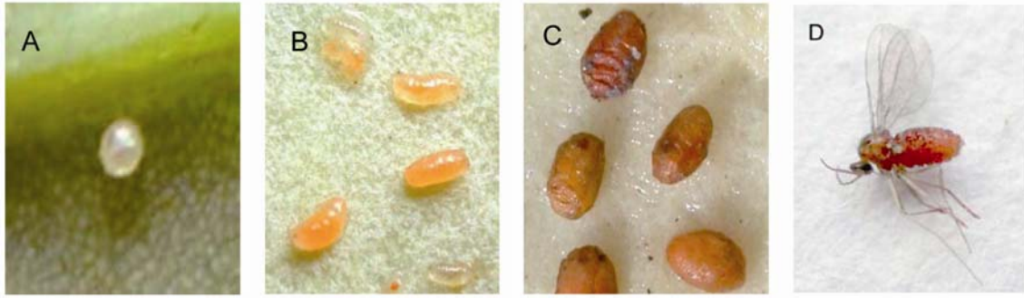
圖一 荔枝瘿蚋各期形態：A. 卵，B. 幼蟲，C. 蛹，D. 成蟲。 Fig. 1. Morphology of Litchiomyia chinensis . A. egg, B. larvae, C. pupae, D. adult.